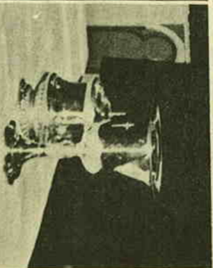
Metsäpiiritin seurakunnan ehtoollis- kalasto vuodelta 1909 luovutettiin Mynämäen seurakunnalle pääsiäise- nä 1950.

Metsäpiiritin viimeisen edellises- sä, 1700-luvun alussa rakennettu- ta kirkosta tiedetään, että sen ka-