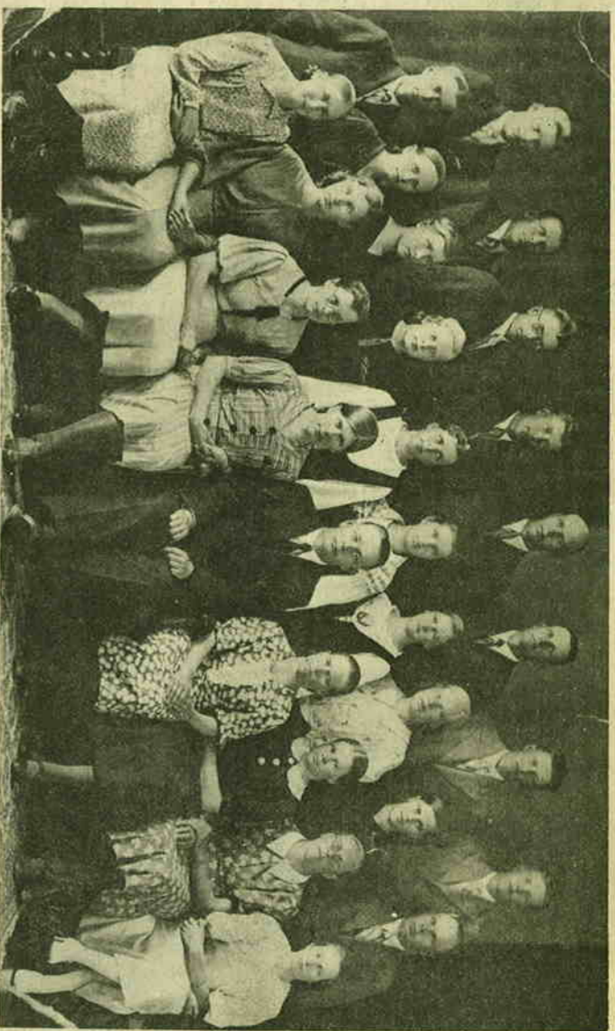
Metsäpiiritin kirkkokuoro Vaasaan laulujuhlilla v. 1939.