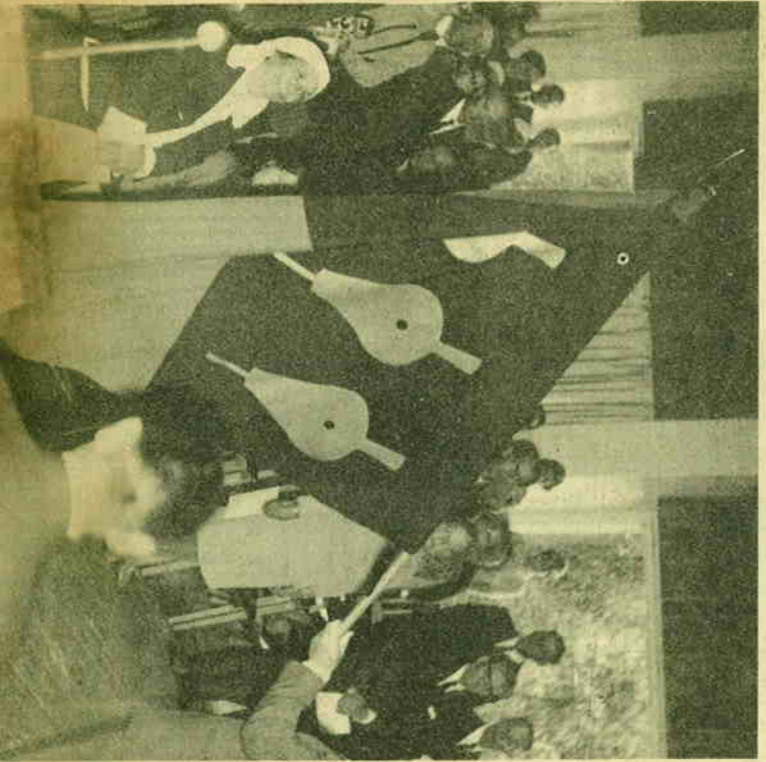
Pälkjärven pitäjän seurassa loppu vihittiin 6. 7. 1969 seurassa 20-vuotis-juhlassa Joensuussa.